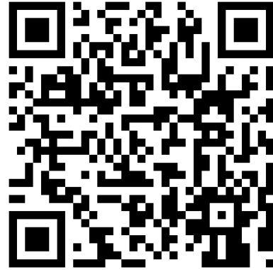
QR-Code Meine Umwelt-App

Weitere Informationen zur Asiatischen Hornisse und wie sich die Art von heimischen Insekten unterscheiden lässt finden sich auf der Homepage der LUBW