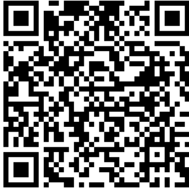
QR-Code Meldeplattform Asiatische Hornisse

Württemberg. Dies ist über die Meldeplattform auf der Homepage der Landesanstalt für Umwelt (LUBW), aber auch über die kostenlose „Meine Umwelt-App“ möglich: